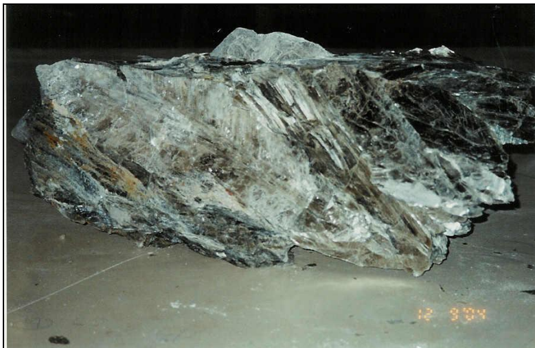
Figura 1 – Moscovita proveniente da província pegmatítica da Borborema (RN).