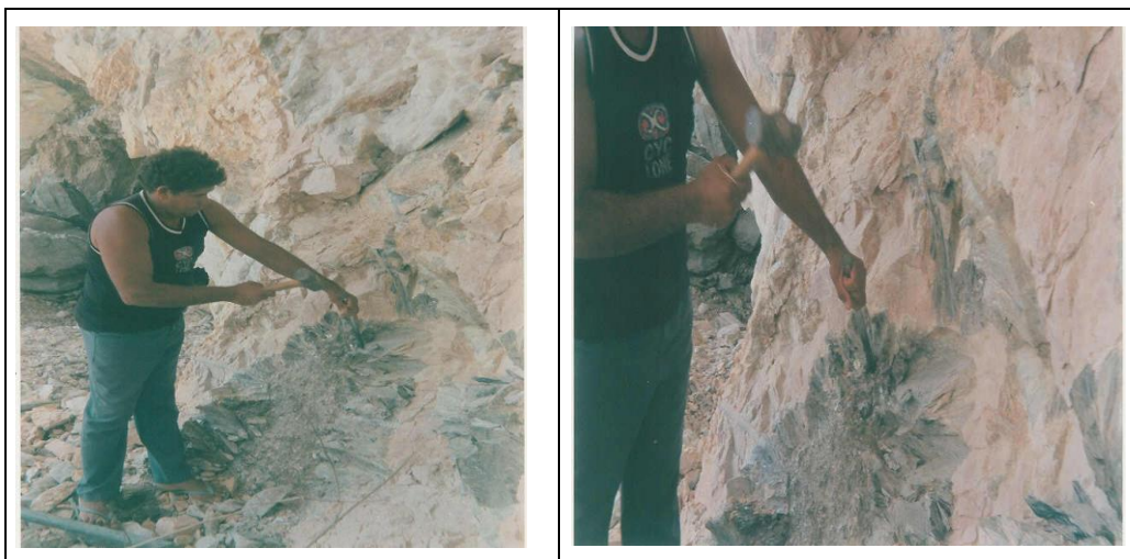
Figura 2 – Lavra manual de moscovita com o uso do “pixote”, na mina de Ubadeira, em Currais Novos, RN.