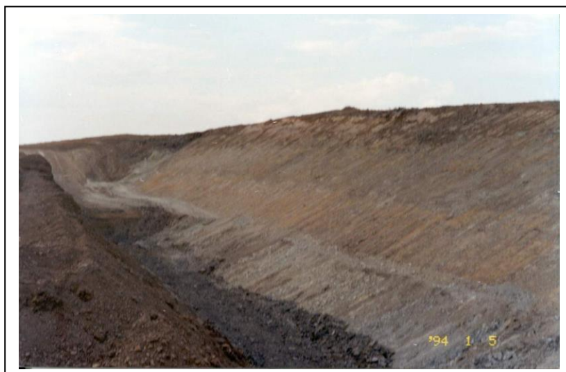
Figura 1 – Frente de lavra típica de uma mineração de bentonita em Greybull, Estado de Wyoming-EUA (Luz et al. , 2001a).

A bentonita, conhecida como de Wyoming, é lavrada nos três principais distritos mineiros que atravessam os estados de Wyoming, Montana e South Dakota. As cinco usinas que produzem bentonita sódica na região constituem o distrito mineiro de bentonita sódica mais antigo do mundo (Elzea e Murray, 1994).