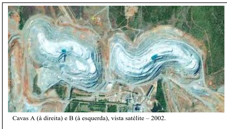
Figura 2 – Cavas A (à direita) e B (à esquerda), vista satélite – 2002.