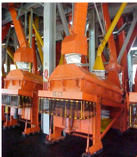
Peneiras Giratórias Fournier