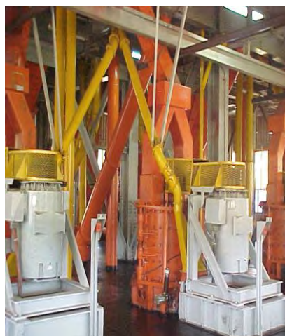
Moinho de Impacto JM