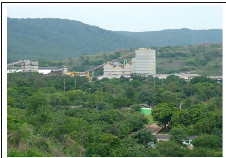
Figura 4 – Vista geral da área industrial.

A Qualidade do Processo Industrial e a Qualidade do Meio Ambiente são certificadas e auditadas pelo OCC Det Norske Veritas - DNV , com base no cumprimento das Normas NBR ISO 9001/2000 e NBR ISO 14000/2004, respectivamente. Da mesma forma, a Qualidade do Ar Ocupacional e Ambiental é controlada e auditada pelo Centro de Evaluacion, Medicion y Seguridad Ocupacional - CEMSO S.A. com base na Norma do Uso Controlado do Amianto - UCA, segundo a Organização Internacional do Trabalho - OIT.