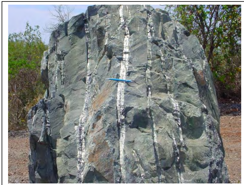
Figura 1 – Bloco de serpentinito com veios de crisólita.

Com essas propriedades, o amianto permite a fabricação de mais de três mil produtos, dentre os quais os de fibrocimento (que corresponde hoje mais de 96% do consumo final das fibras produzidas na mina de Cana Brava), fricção, têxtil, papel e papelão, filtros, revestimentos de pisos e isolantes térmicos.